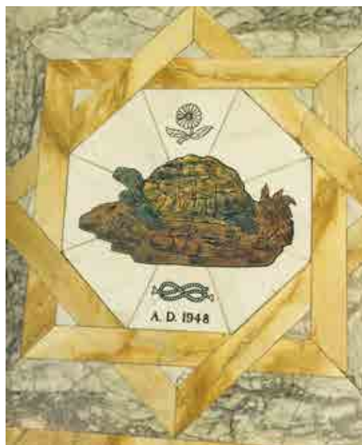
3. Graffito del pavimento