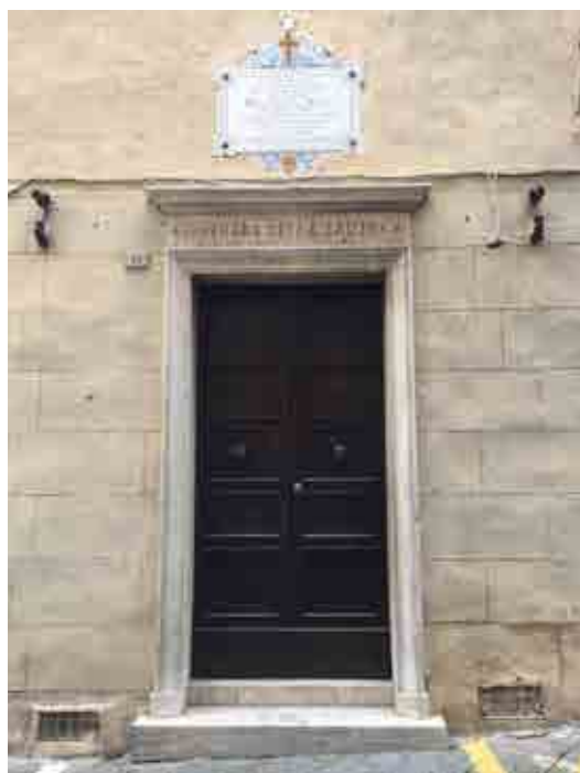
1. L'ingresso del Museo inaugurato nel 1948