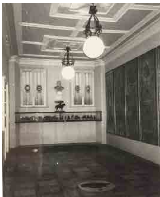
2. Sala delle vittorie

Il 4 ottobre il Seggio della Tartuca tenne la sua prima riunione nei nuovi locali. Con vetrine illuminate al neon e la nuova "sala delle vittorie" con i drappelloni nelle teche, un pavimento in marmo nel quale spiccava una bella tartaruga e le bacheche di vetro per i cavallini intagliati in legno, per quei tempi l'ambiente poteva finalmente assumere il titolo di Museo.